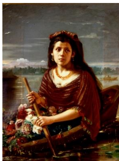
Fig. 5. Manuel Ocaranza, La Flor del Lago , 1871, óleo sobre tela, 130 x 100 cm, Colección Luis Antonio Loredo Hill.

Al igual que muchas de las pinturas de campesinas europeas, tanto La flor del Lago como La papanteca representan a jóvenes quienes realizan, idealmente, alguna labor cotidiana de campo al mismo tiempo que van engalanadas con trajes de fiesta. Mientras que la pintura de Ocaranza muestra a una joven portando flores en su “trajinera,” una especie de canoa utilizada para atravesar los canales lacustres que funcionaban como vías de transportación en el Valle de México, donde ella navega, Osorio concibió una composición en la que la figura central es una joven con un traje de origen totonaca, que ha ido a recolectar agua con su cántaro a un manantial.