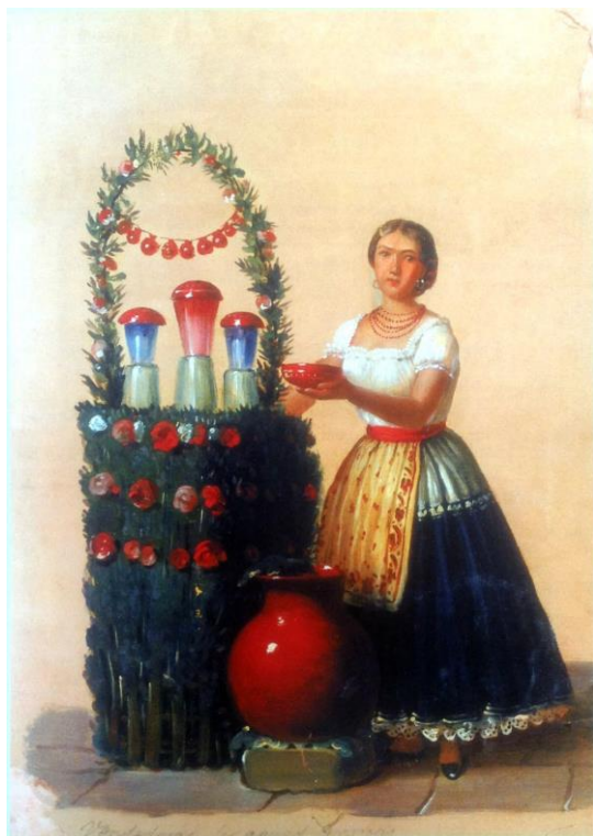
Fig. 7. Édouard Pingret, La vendedora de aguas frescas , ca. 1852, óleo sobre papel, 40 x 29 cm, Colección Banco Nacional de México.

Encontramos en la pintura otro elemento que podría estar funcionando de una manera similar: la jícara que lleva en la mano podría disfrazar una referencia más a su propio cuerpo el cual, además, lleva el mismo color verde de la cinta que adorna su mantilla y el rojo del paño que cubre su busto. Este otro ícono había sido mencionado ya en el relato de Charpenne, siendo el recipiente que la indígena presenta tanto para recibir como para ofrecer bebida.