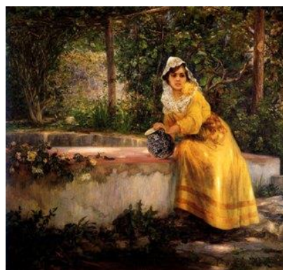
Fig. 6. Germán Gedovius, Dama con cántaro , s/f, óleo sobre tela, 120 x 120 cm, Colección Banco Nacional de México.

convirtiéndolas en una personificación de una sexualidad sin artificios. 48 En este sentido, es de notarse que en los retratos de campesinas mexicanas producidos entre la década de 1860 y 1880 estas aparecen representadas en un escenario natural, a diferencia de la campesina de Bernadet, que data ya del fin de siglo, la cual es la única que aparece en un ámbito doméstico y, por lo tanto, civilizado.