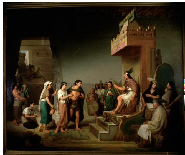
Fig. 9. José Obregón, El descubrimiento del pulque , 1869, óleo sobre tela, 186 x 231 cm, Museo Nacional de Arte de México.

Vemos entonces cómo el motivo de la jícara estuvo presente en numerosas representaciones artísticas y gráficas en el México decimonónico, funcionando como metáfora del cuerpo erotizado de dos distintas mujeres mexicanas -la indígena y la mestiza- el cual, al igual que el cántaro de las campesinas europeas, parece aludir a amores ilícitos. 60