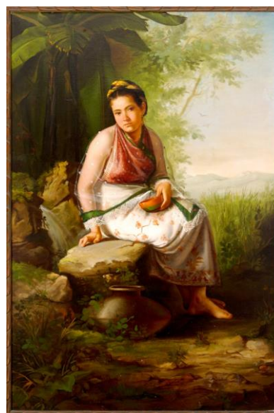
Fig. 1. Luz Osorio, La papanteca , ca. 1880, óleo sobre tela, 140 x 94 cm, Colección Luis Obregón Zetina.

Luz Osorio nació en Papantla, Veracruz, el 14 de febrero de 1863. 4 Sus padres fueron Lorenzo J. Osorio y Adelaida Romero, ambos también oriundos de Papantla, en donde Osorio vivió los primeros años de su infancia. Hacia 1869 la familia se estableció en la ciudad de Puebla, 5 cercana geográficamente a la ciudad de México y una de las urbes más importantes del país desde la colonia y a lo largo del siglo XIX, en donde tuvieron tres hijos más y donde Osorio recibiría su formación artística.