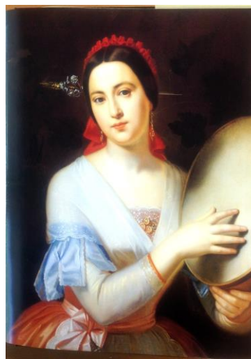
Fig. 4. Juan Cordero, Mujer con pandero (Traje albanés, media figura de una joven tocando la pandereta) , 1847, óleo sobre tela, 74 x 62.2 cm, Colección Banco Nacional de México.

En 1871 Manuel Ocaranza presentó La flor del Lago ( Fig. 5 ) en la XV Exposición de la Academia de San Carlos. Como ha señalado Velázquez Guadarrama, esta pintura representa una primera regionalización del género, 33 al dejar atrás a las campesinas europeas como sujeto de su composición y elegir en su lugar a una joven mexicana engalanada con un traje regional. Sería en la línea de este nuevo género de composiciones en la que se inscribiría La papanteca de Osorio, la cual muestra a una joven indígena vestida con un traje de su natal Papantla.