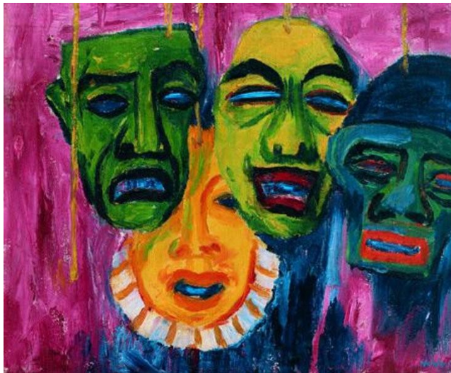
Fig. 2. Emil Nolde, Maskenstilleben II , óleo sobre tela, 65,5 x 78 cm, 1911. Coleção Ada e Emil Nolde, Seebüll.

infância da história da humanidade. Na obra de Nolde, esse pressuposto foi levado às últimas consequências, no qual alguns trabalhos de sua autoria representam figuras negras em estágio de “regressão”, assemelhando-se à macacos.