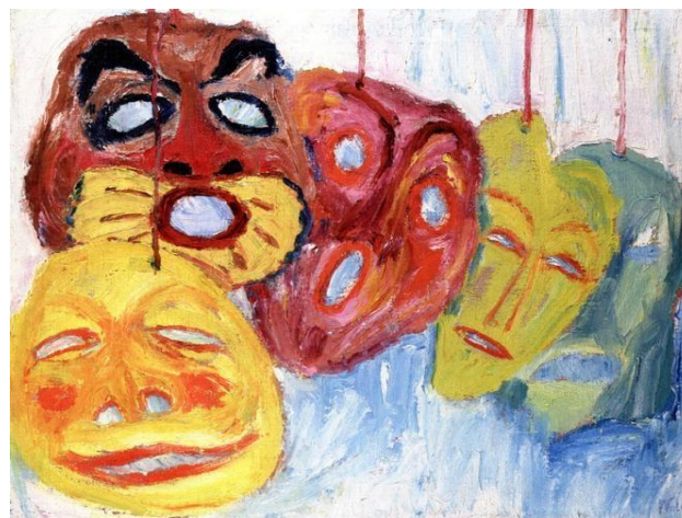
Fig. 1. Emil Nolde, Maskenstilleben I , óleo sobre tela, 64 x 78,5 cm, 1911. Coleção Ada e Emil Nolde, Seebüll.

encontro de Nolde com o artista James Ensor (em uma de suas viagens para a Bélgica) que fez uso corrente das máscaras em sua obra como uma alegoria da realidade grotesca do comportamento humano ( Fig. 1 ).