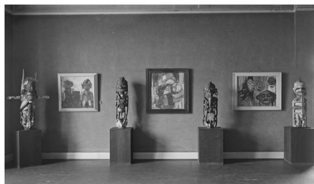
Fig. 3. Autor desconhecido, Ausstellungsraum Expressionisten und Exoten. Zeitgenössisches Malerei und Stammeskunst , fotografia, dimensões desconhecidas, c. 1921. Karl Ernst Osthaus Archiv. © Bildarchiv Foto Marburg.